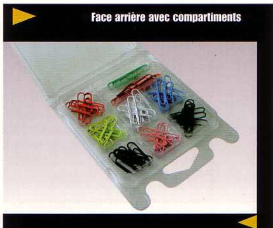
Face arrière avec compartiments