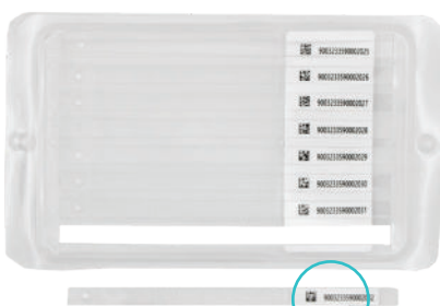
Impression QR code