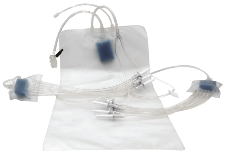
SYSTÈME DE POCHÉ POOL (JUSQU'À 10L)