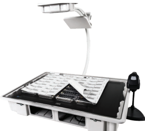
CARROSSERIE POUR PILULIER INFORMATISÉ