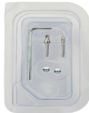
BLISTER NO TOUCH