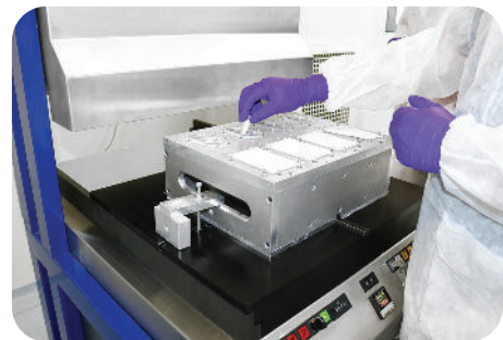
Scellage des blisters