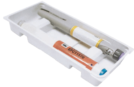
CALAGE POUR STYLO INJECTEUR