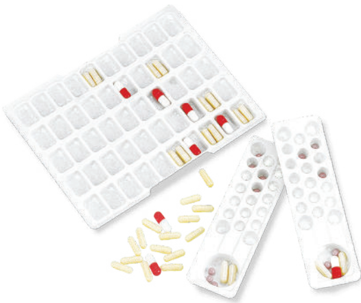
PILULIER POUR LA PRÉPARATION DE DOSES À ADMINISTRER (PDA)