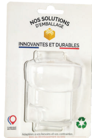
BLISTER CARTE PORTE FEUILLE