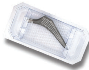
Blister & Opercule