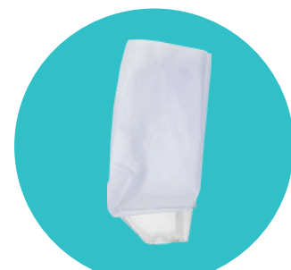
Gaine souple + coque de protection