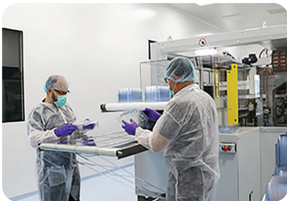
Fabrication de blisters