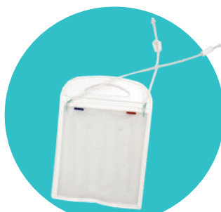
Support rigide + poche souple