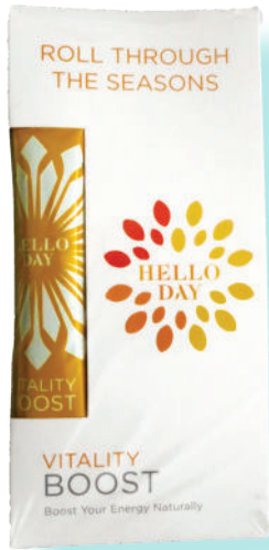
MISE SOUS FILM RÉTRACTABLE