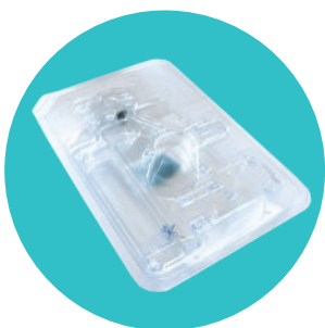
Kit thermoformé + poche