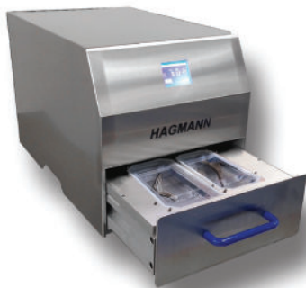
Machine de scellage