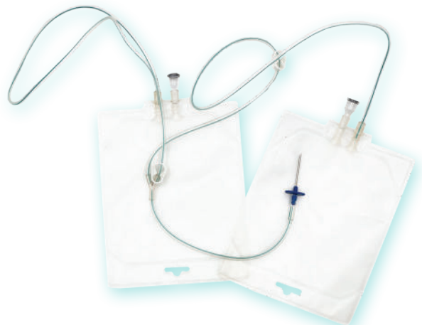
POCHE DE TRANSFUSION SANGUINE VÉTÉRINAIRE