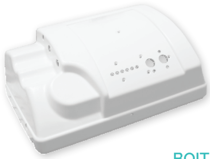
BOITIER D'APPAREIL MÉDICAL