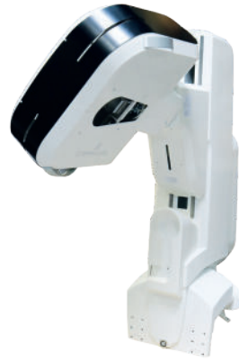
CAPOTAGE COMPLET POUR MACHINE DE RADIOLOGIE