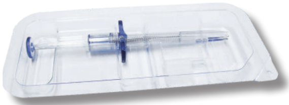
BLISTER POUR SERINGUES

Nous offrons, en outre, des options de personnalisation pour répondre aux besoins spécifiques de chaque produit, tout en utilisant des matériaux durables et respectueux de l'environnement.