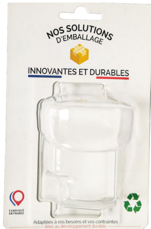
BLISTER CARTE PORTE FEUILLE

Étanchéité : maintient une barrière efficace contre l'humidité