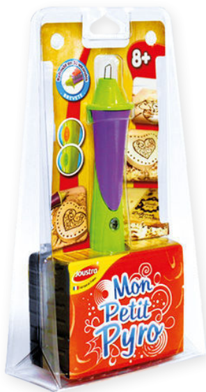
COQUE À PIED