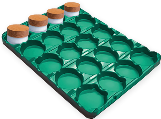
PLATEAU DE TRANSPORT