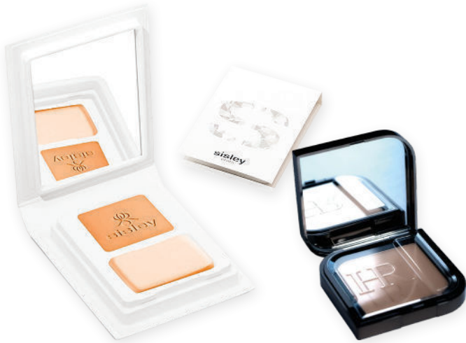
COQUE ET PROTECTEUR

Grâce à notre expertise et nos savoir-faire, vos produits bénéficient de divers avantages : Stabilité : conçus pour rester parfaitement en place, même en cas de manipulation fréquente Visibilité : design transparent et attrayant, mettant en avant le produit Empilabilité : permet un stockage efficace, maximisant l'espace en rayon Ergonomie : faciles à manipuler, rendant le réassort simple et rapide