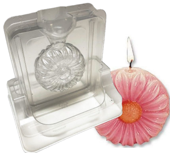
DOUBLE COQUE À PIED